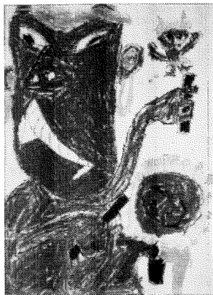
「あかおに」 御嵩小児童作品