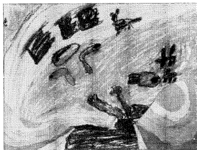
「うみのなかにあるたまご」 伏見小児童作品