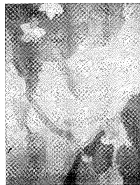
「夏野菜」 共和中生徒作品