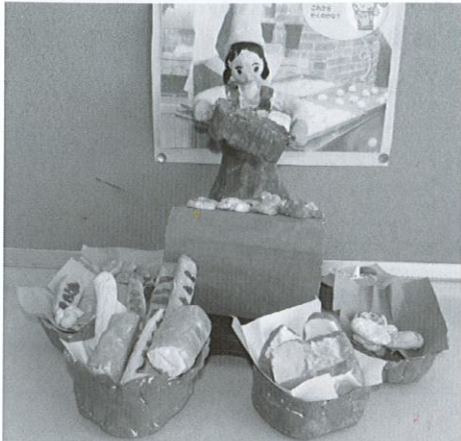
「12年後のわたし」 御嵩小児童作品