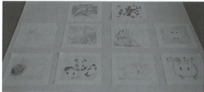
「動物」 共和中生徒作品