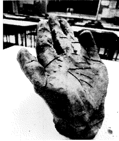
「手は語る」 向陽中生徒作品