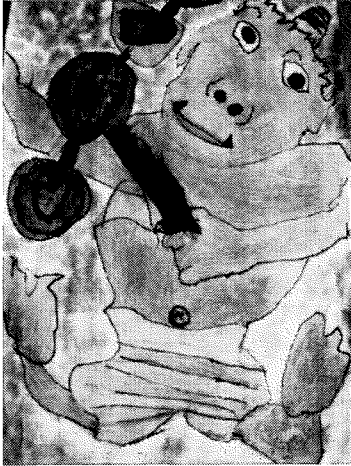
「かみなりごろごろ」 御嵩小児童作品