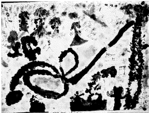
「あやしいひとかげ」 伏見小児童作品