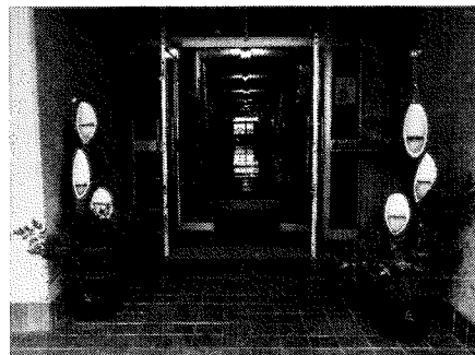
「門松」 共和中生徒作品