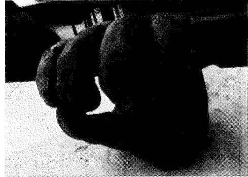
「自分の手」 向陽中生徒作品