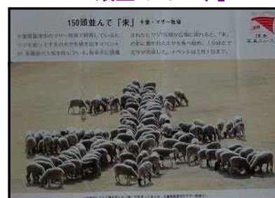
▲ 掲示中のニュースの一部