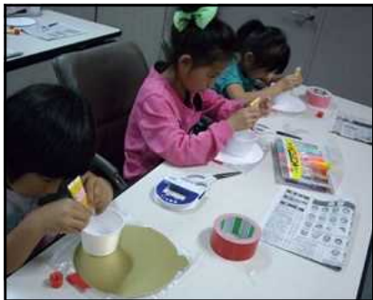
▲ホバークラフト作り

このあと、生活科の学習で1年生の子と行う「おもちゃ屋さん」の取組のヒントになるものをたくさん見つけてきました。1年生の子が喜んでくれるような、おもちゃ屋さんを開きたいと思います。また、長良公園では、お弁当を食べ、遊具などで遊びました。仲間と共に活動する楽しさを味わった、秋の一日となりました。