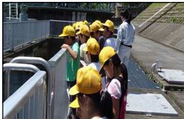
▲山之上浄水場の見学