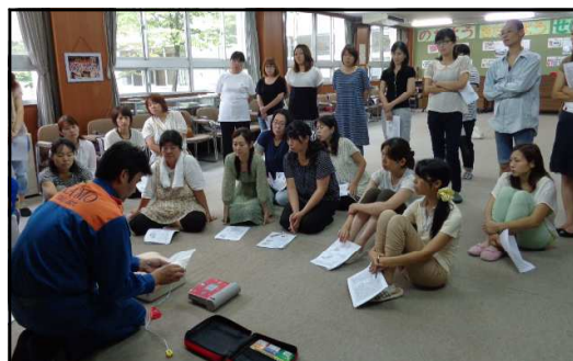
▲救急救命法研修会 会議室にて

この研修会は、夏休みのプール開放に向けて、毎年実施しているものです。可茂消防事務組合南消防署御嵩分署の署員の方に、心臓マッサージやAEDの使い方、万が一の場合の対処の仕方など、具体的に体験を通してご指導いただきました。昨年以上に、多くの保護者の皆さんにご参加いただき、熱心に研修をしていただき、ありがとうございました。