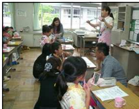
▲親子ブラッシング 3年

学級・学年懇談会では、和やかな雰囲気の中で、1学期の子どもの学習面・生活面の成果や課題等を確認め合い、夏休みの取組についての確認をしました。1学期も残りわずかとなりましたが、1学期のしめくくりを大切に、健康で充実した夏休みになるよう、生活してほしいと考えていますので、ご家庭でも特に 安全面(交通事故や水の事故)での見届け をよろしくお願ひします。