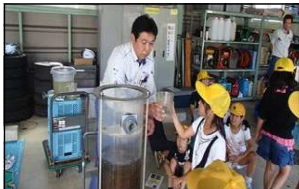
▲ 浄水場の職員の方と共に実験

私たちが普段飲んだり、使ったりしている、暮らしになくてはならない水道水が、どこからきて、どのようにできるのか、自分の目で実際に確かめることができました。今後の学習に生かしていきたいと思ひます。